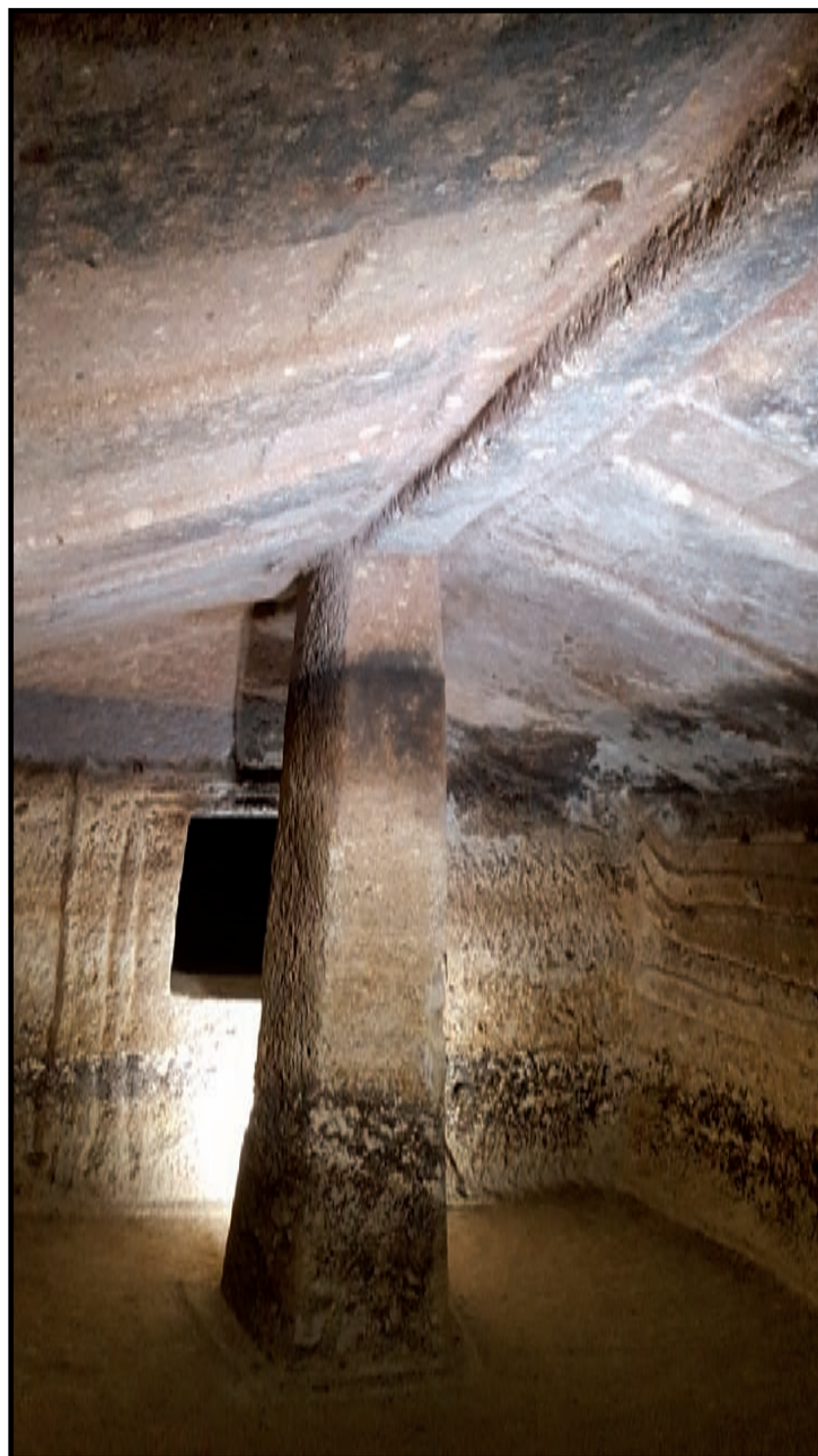
Putifigari, domus de janas S'Incantu , (3200-2800 a.C.)