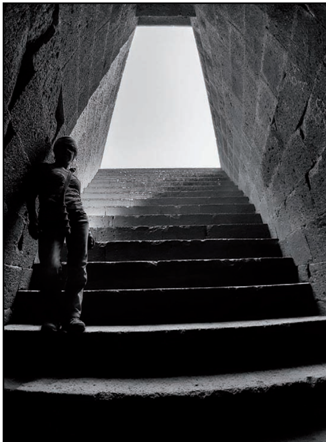
Paulilatino, pozzo sacro di Santa Cristina , (XI secolo a.C.)