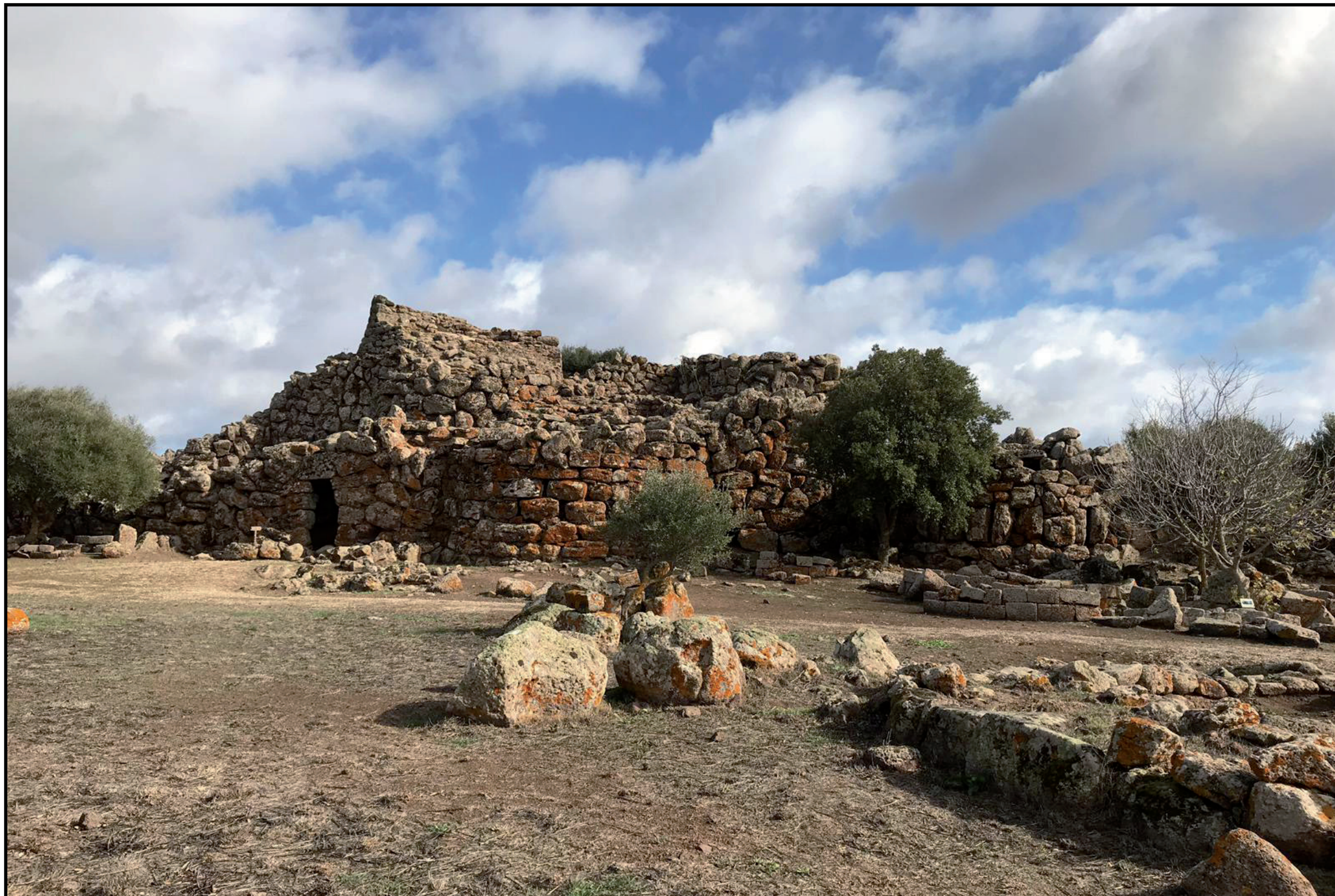
Orroli, nuraghe Arrubiu , (XIV-XII secolo a.C.)