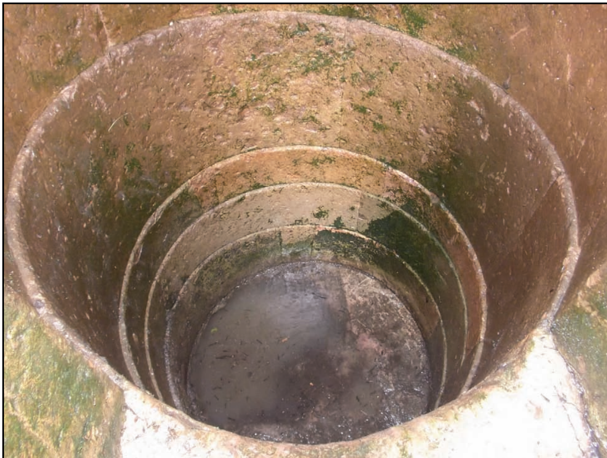
Nuoro, camera pozzo sacro nuragico di Noddule , (1200-900 a.C)