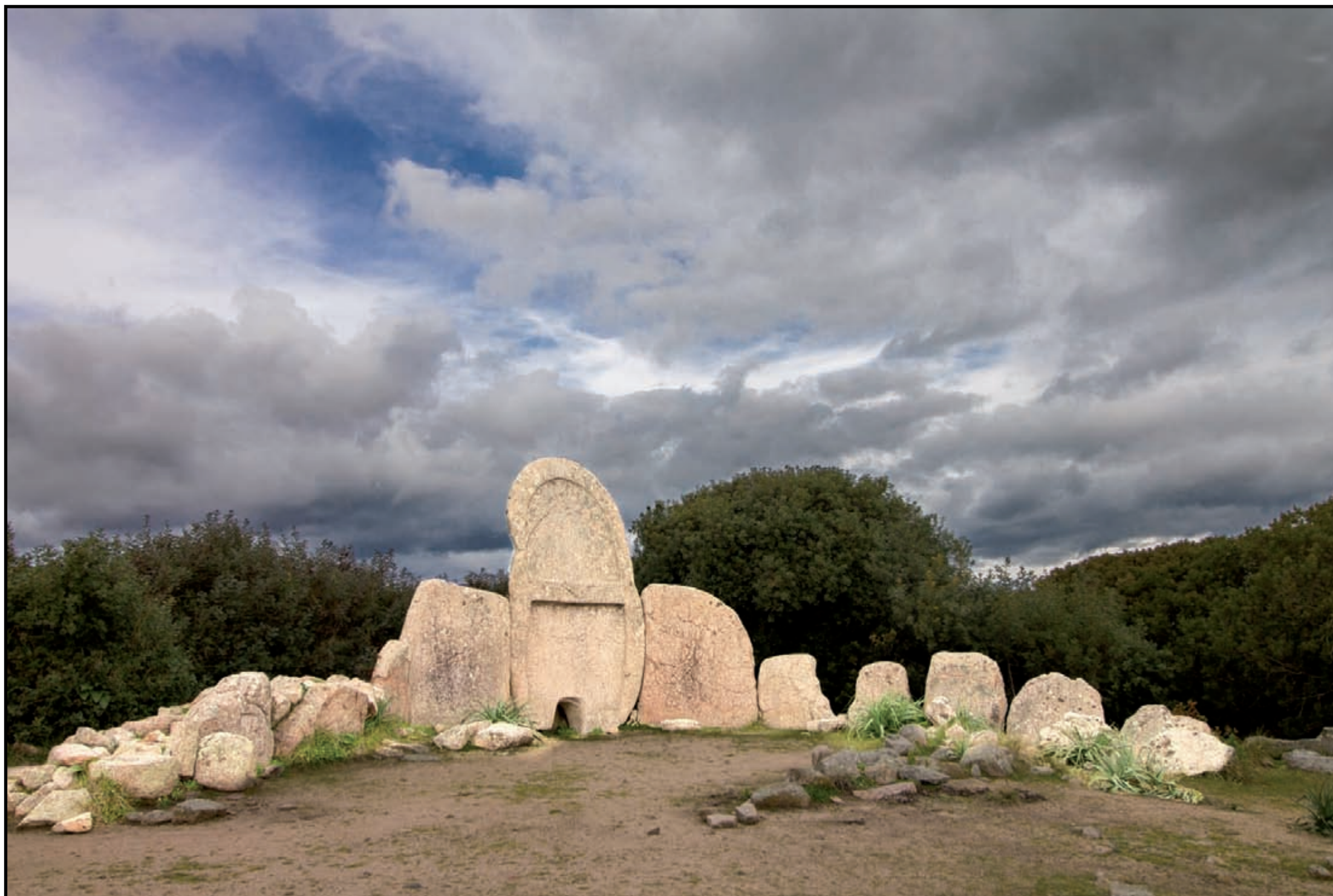
Dorgali, tomba dei giganti S'Ena e Thomes , (1800-1600 a.C.)