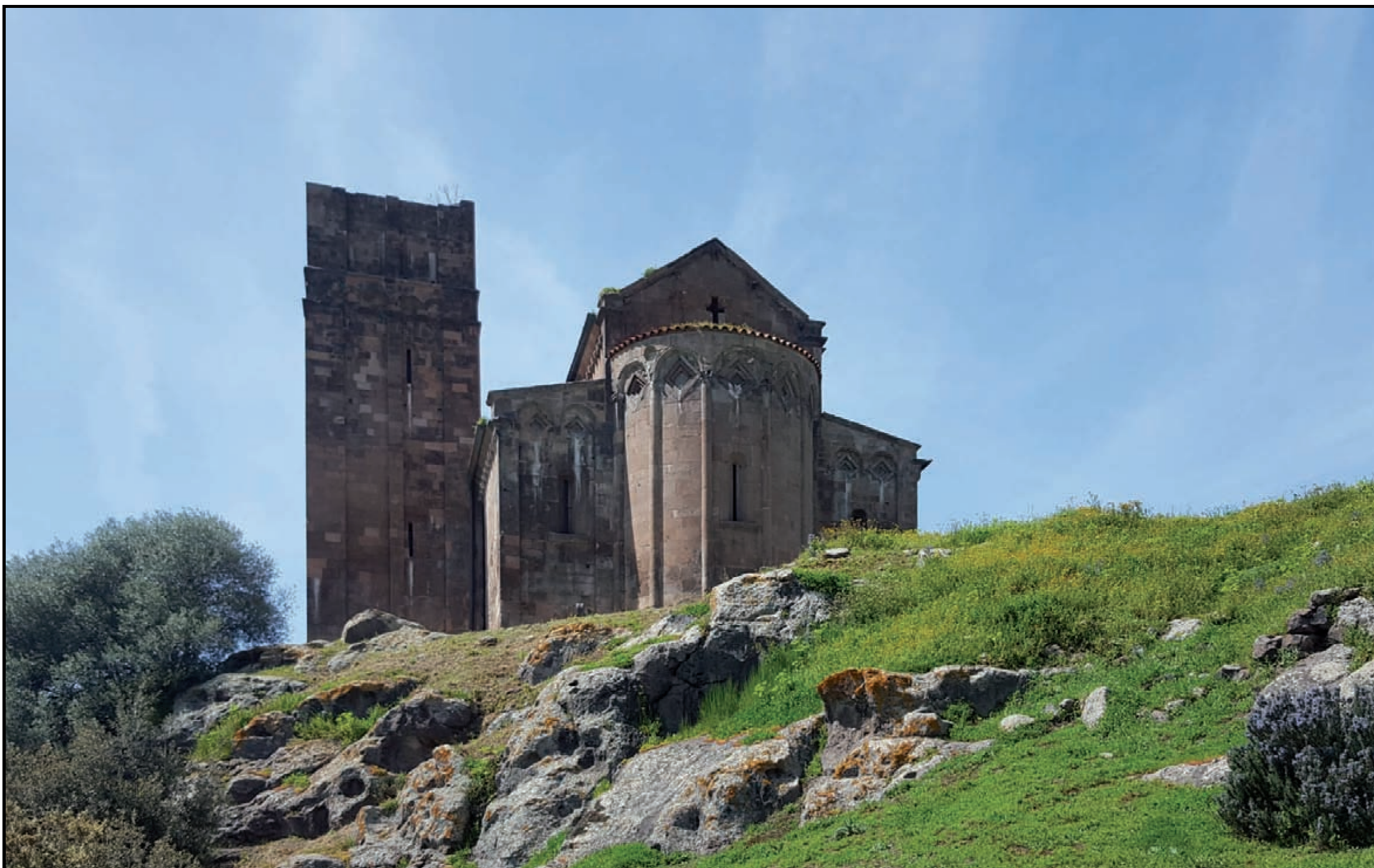
Ozieri, basilica di Sant'Antioco di Bisarcio , (XI secolo)