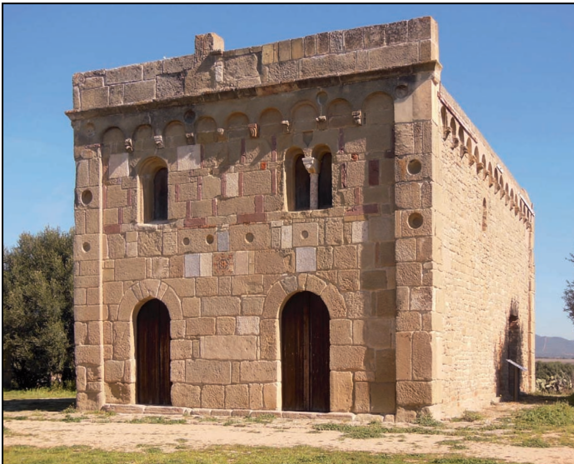
Serdiana, chiesa di Santa Maria di Sibiola , (XI secolo)