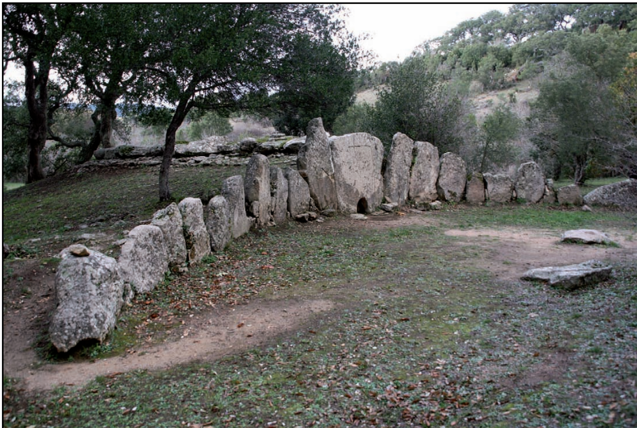
Calangianus, tomba dei giganti di Pascareda , (XV secolo a.C)