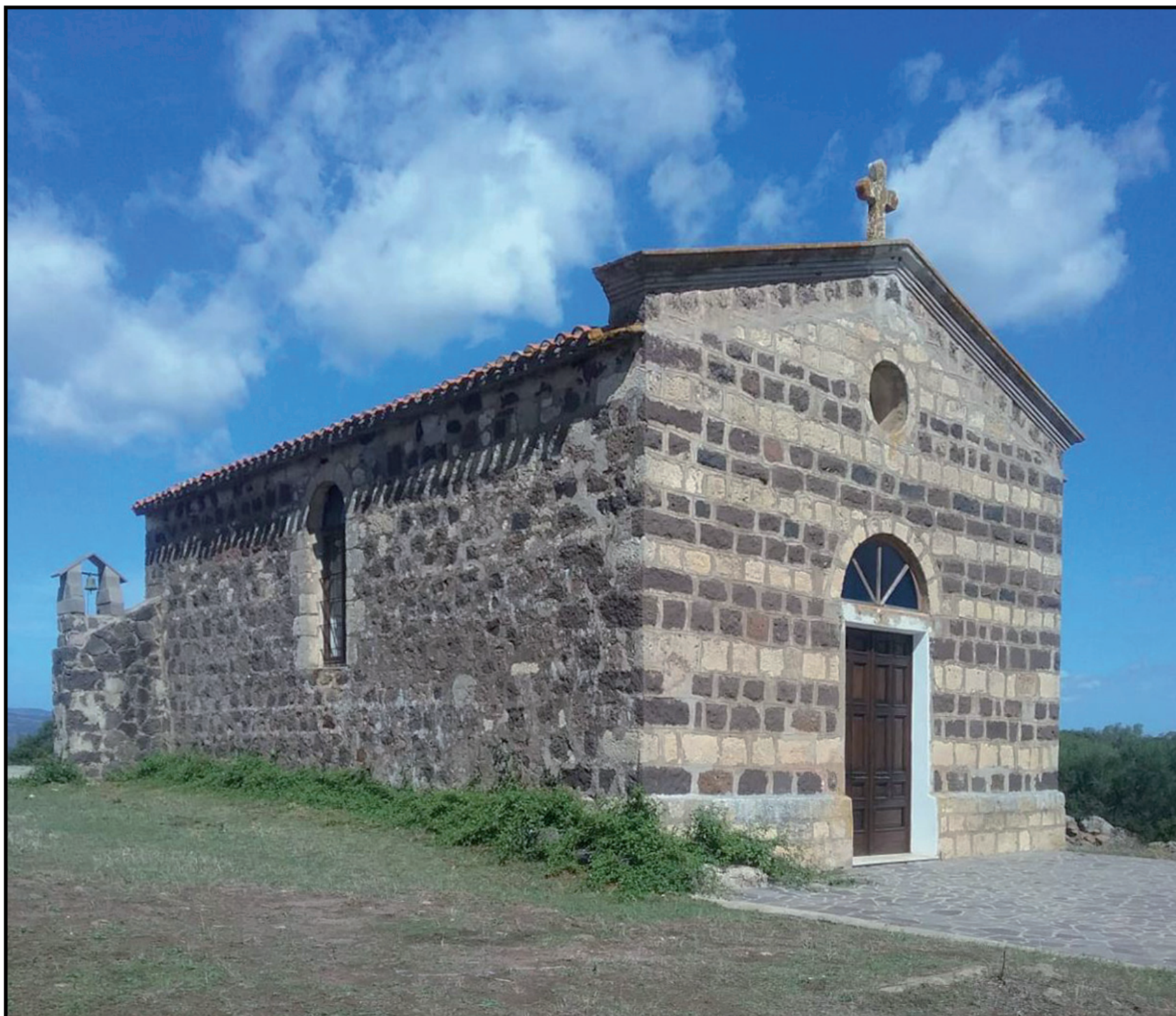
Suni, chiesa di San Narciso , (XVIII secolo)