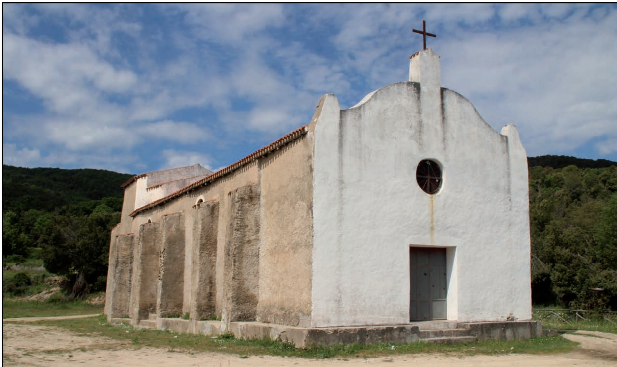
Orgosolo, chiesa di Sant' Anania , (XVII secolo)