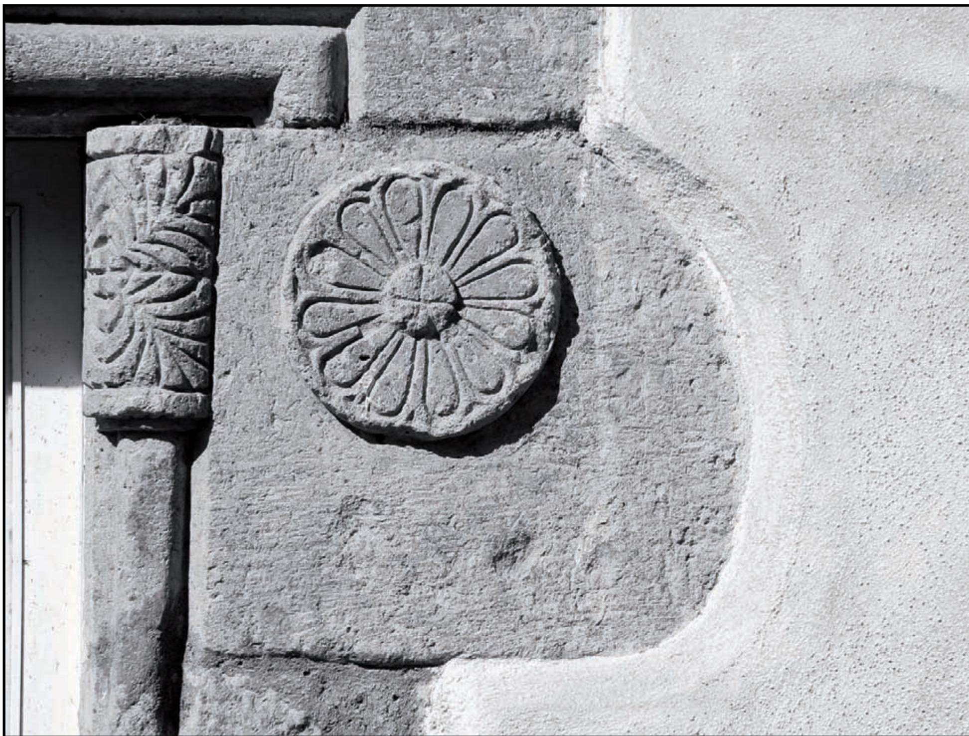
Bortigali, particolare di finestra di epoca spagnola , (XVII secolo)