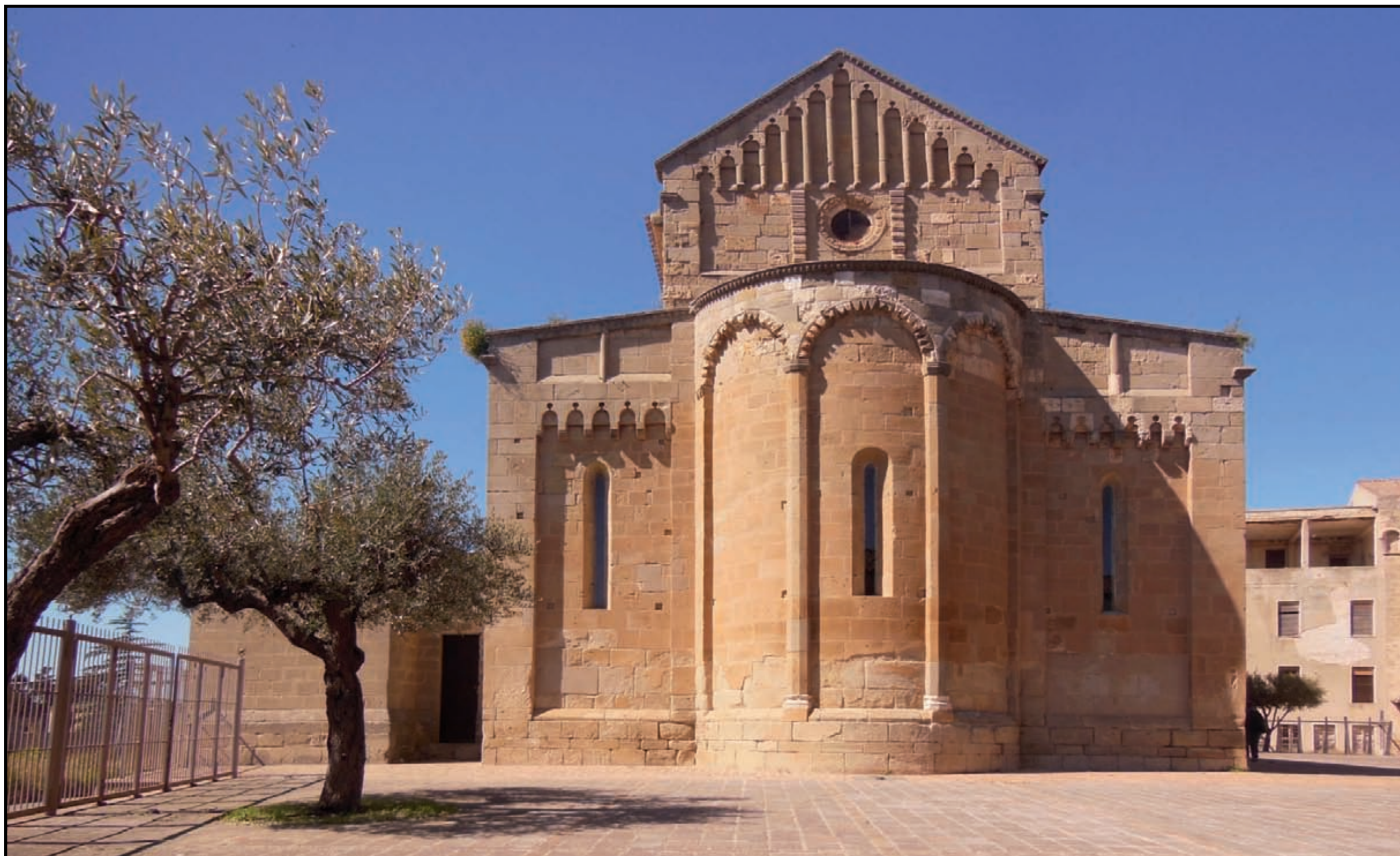
Dolianova, chiesa di San Pantaleo , (XII-XIII secolo)